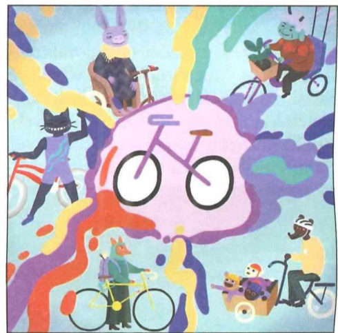
LOGO Cycle Up!

Jdete do toho? Stačí poslat registrační e-mail na: ccwien@czechcentres.cz do 3. dubna. Čas na samotnou výrobu modelu a přípravu všech podkladů máte až do poloviny léta, konkrétně do 15. července.